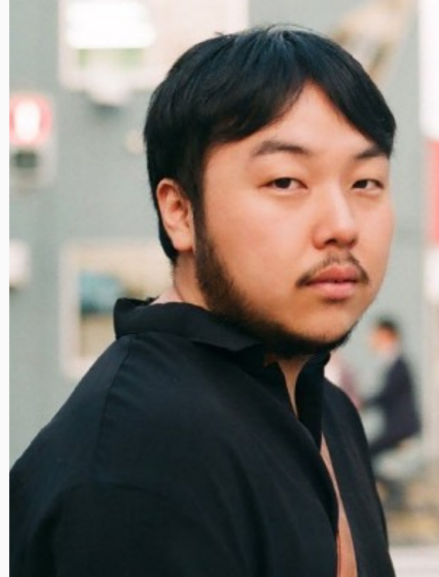
Park ji il Poet