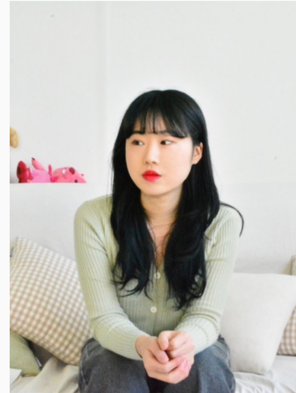
Young Long Musician